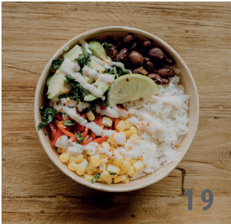
19. Burrito Bowl - kalt