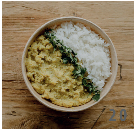
20. Linsen Daal Bowl - warm