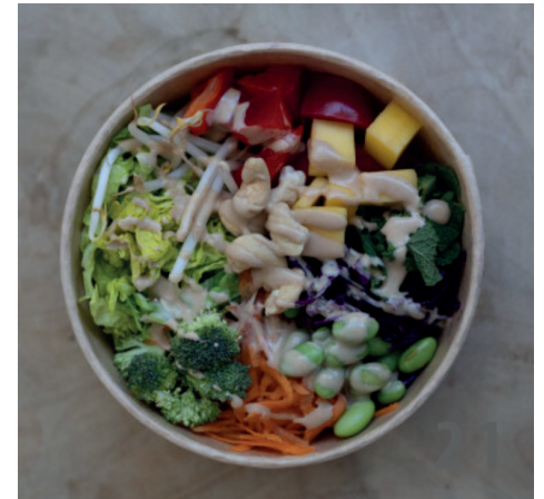
21. Thai Crunch Bowl - kalt

Wir sind immer wieder dabei neue Bowls zu kreieren, gerne entwickeln wir die passende Bowl für Event oder Unternehmen.